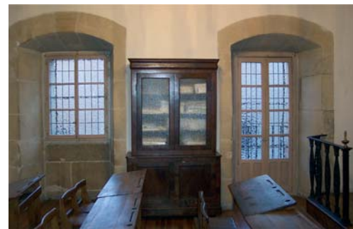
El «Aula de Antonio Machado» en la actualidad. Fue inaugurada el 6 de octubre de 1959 con la presencia de Gerardo Diego.