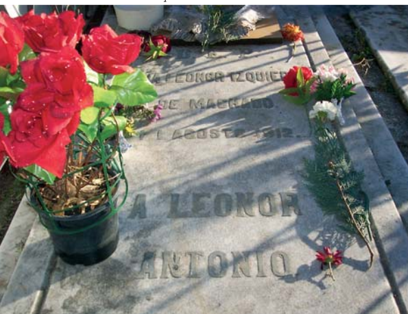
Tumba de Leonor en el Espino.

Allá en las tierras altas por donde traza el Duero su curva de ballesta en torno a Soria, entre plomizos cerros y manchas de raídos encinares, mi corazón está vagando en sueños. ¿No ves, Leonor, los álamos del río con sus ramajes yertos? Mira al Moncayo azul y blanco: Dame tu mano y caminemos. Por estos campos de la tierra mía bordados de olivares polvorientos, voy caminando solo triste, cansado, pensativo y viejo. (CXXI)