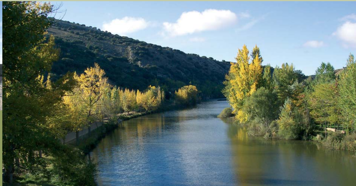
Paseo machadiano entre San Polo y San Saturio, al fondo.

Dice la esperanza: un día la verás, si bien la esperas. Dice la desesperanza: sólo tu amargura es ella. Late, corazón... No todo se lo ha tragado la tierra.