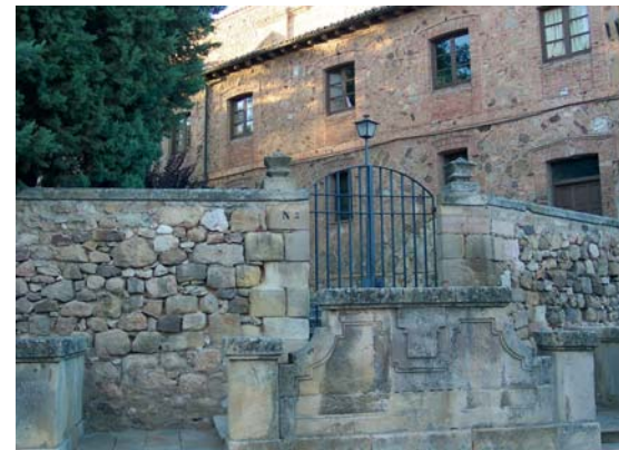
El Hospicio. Actual Centro Cultural «Tirso de Molina»

Es el hospicio, el viejo hospicio provinciano, el caserón ruinoso de ennegrecidas tejas en donde los vencejos anidan en verano y graznan en las noches de invierno las cornejas. Con su frontón el Norte, entre los dos torreones de antigua fortaleza, el sórdido edificio de grietados muros y sucios paredones, es un rincón de sombra eterna. ¡El viejo hospicio! Mientras el sol de enero su débil luz envía, su triste luz velada sobre los campos yermos a un ventanuco asoman al declinar el día, algunos rostros pálidos, atómitos y enfermos, a contemplar los montes azules de la sierra; o de los cielos blancos, como sobre una fosa, caer la blanca nieve sobre la fría tierra, ¡sobre la tierra fría la nieve silenciosa!