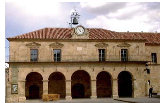
El Reloj de la Audiencia.

¡Soria fría! La campana de la Audiencia da la una. Soria, ciudad castellana ¡tan bella! Bajo la luna.