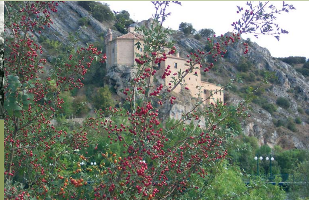
Ermita de San Saturio.