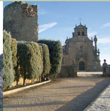
Iglesia del Mirón.