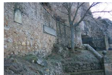
El Rincón del Poeta, junto a la entrada de la Ermita de San Saturio.