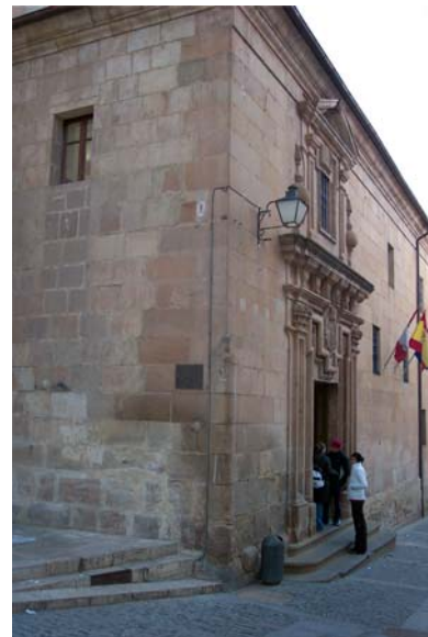
Instituto «Antonio Machado»

Despacio y buena letra que el hacer las cosas bien importa más que el hacerlas. NUEVAS CANCIONES (CLXI)