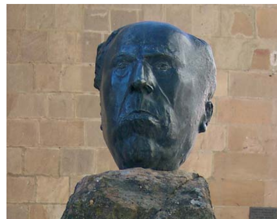
Escultura de Antonio Machado en la puerta del Instituto que lleva su nombre. (Autor: Pablo Serrano)